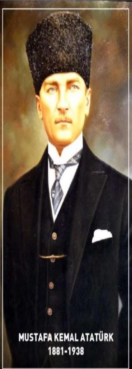
MUSTAFA KEMAL ATATÜRK 1881-1938